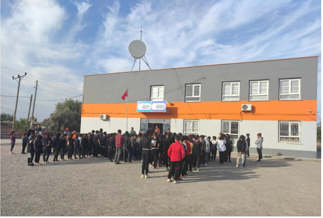
Resim-1 Okulumuzdan görüntüler